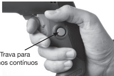
Botão Trava para trabalhos contínuos

duração, pode-se utilizar o botão de trava. Após pressionar o gatilho, aperte o botão de trava para manter a ferramenta em funcionamento sem a necessidade de exercer pressão no gatilho. Pressione o gatilho novamente para desativar essa função.